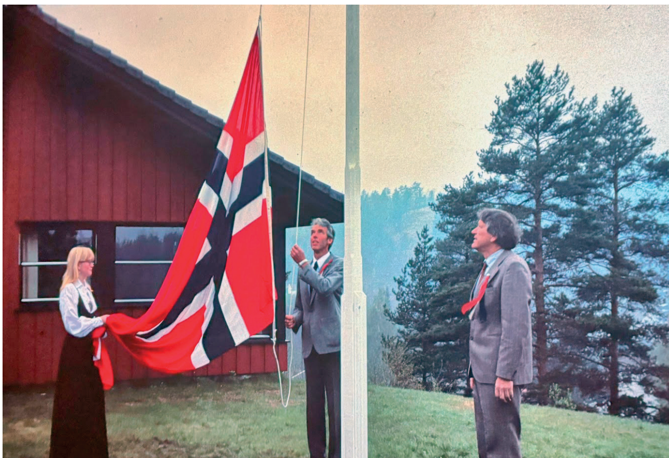
Første flaggheising 17. mai 1984.