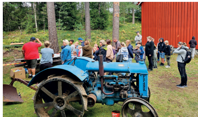
Lang kø for å skyte med luftgevær.