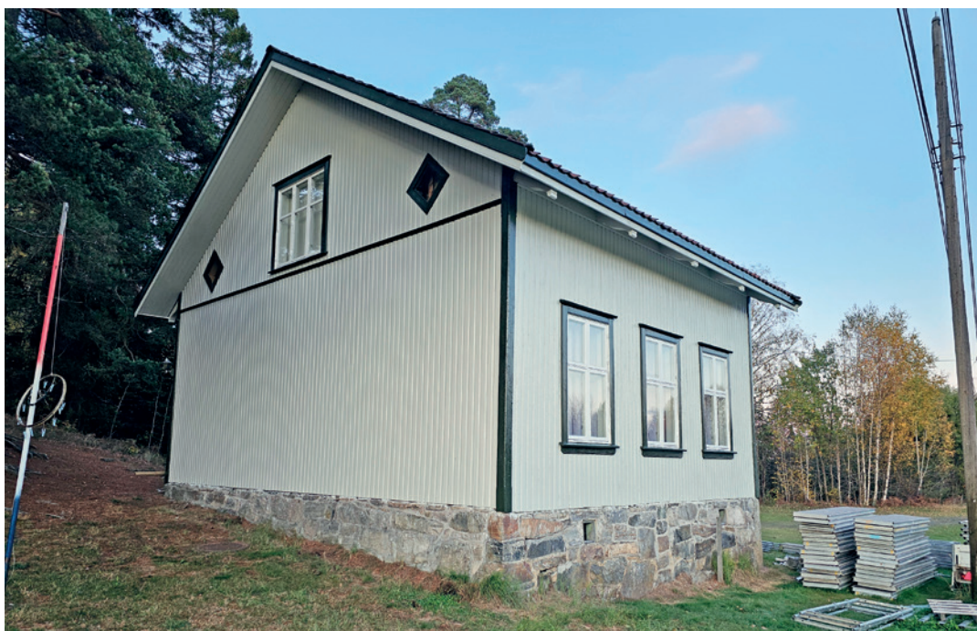
Skolen har blitt som ny etter god dugnadsinnsats.