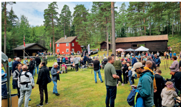
Det var mye folk på Bygdetunet denne dagen.