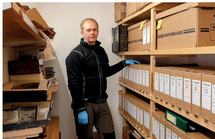
Gamle protokoller fra lag og foreninger i Sannidal har blitt fotografert, registrert og lagt i egne arkivbokser. Disse står nå i system i hyllene.

gjenstandene og protokollene vaskes og renses. Protokollene blir registrert og lagt i system i egne arkivbokser.