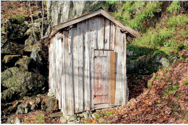
Kvernhuset på Dalen er fremdeles på det nærmeste intakt.