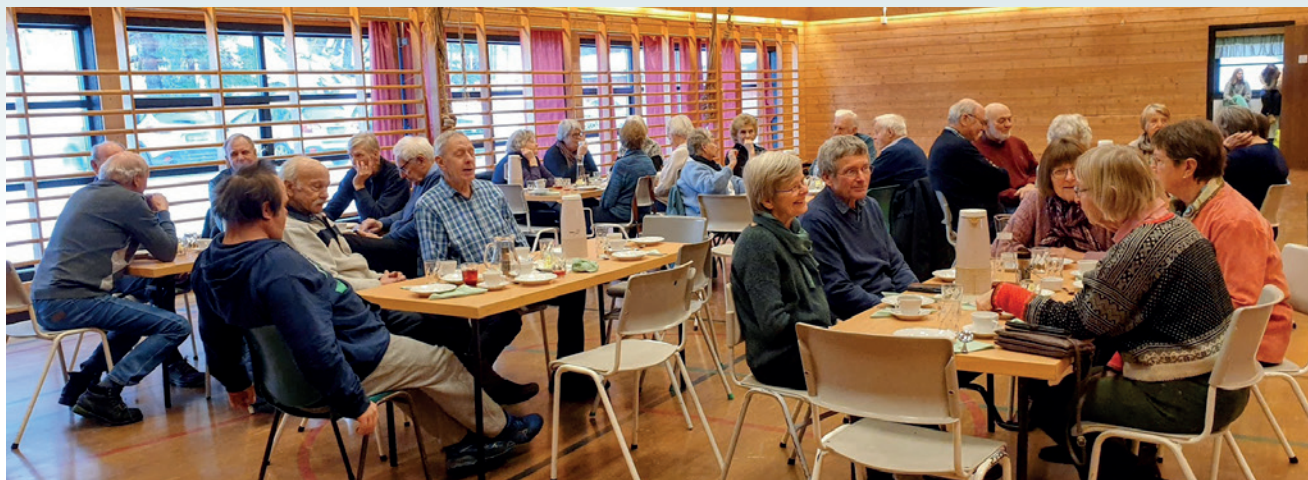
De fleste av de fram møtte har vært med på mange Bygdetundager opp gjennom årene.