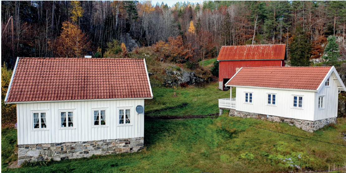
Huset og bryggerhuset på Dalen, slik disse står i dag. Husene er restaurert og svært godt vedlikeholdt.