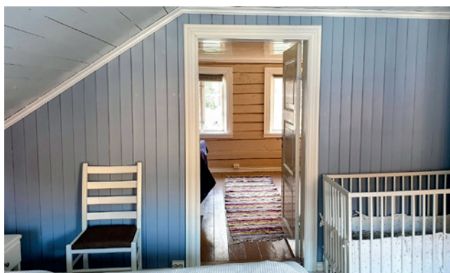
Glimt fra annen etasje.