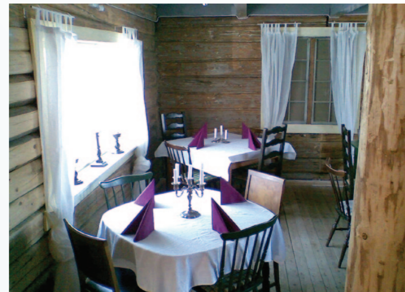
Den gamle klokkerstua er satt i fin stand av de nye eierne av Wesselgården.