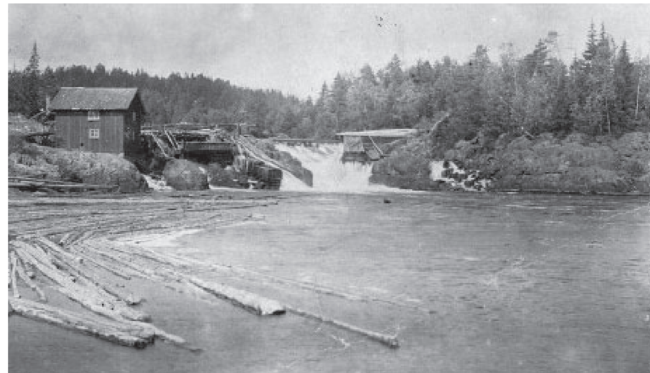
Tveitereidfoss med Mølle ca. 1920.

– I denne tida var det, som vi vet, stor matmangel blant folk. Mange dyrket korn på små flekker, og det var hektisk aktivitet på Tveitereid mølle. Selv om det var møller både i Bamble (Tangvald) og i Drangedal (Fineid), kom folk fra hele distriktet hit til Tveitereid for å få kornet malt. Mølla gikk i perioder på 2 skift. Men som ledd i rasjoneringen var den også stengt i perio-