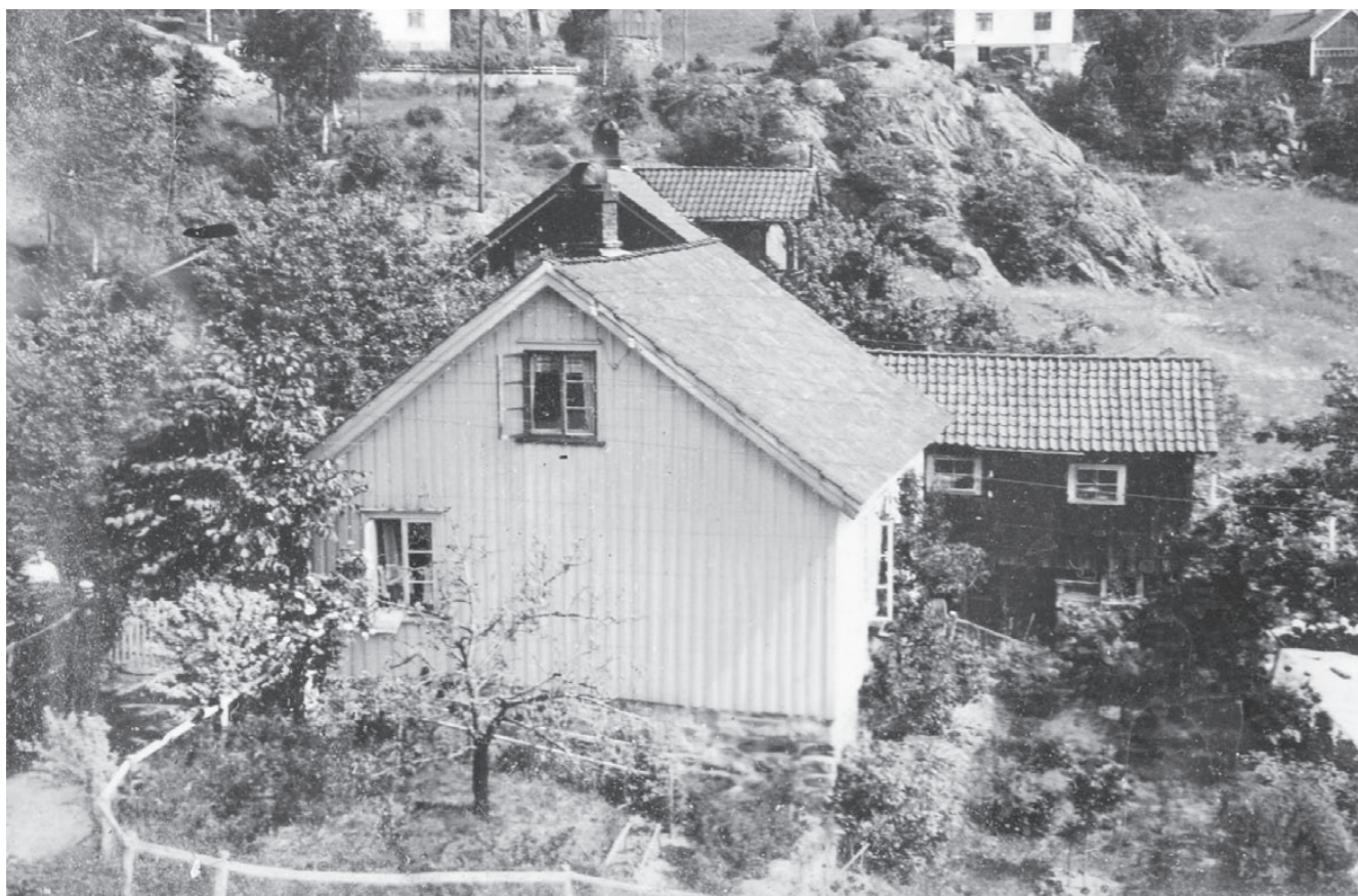
Gurines hus kalles Strømdal 1 og er det samme som Brattekleiv 5.

Efter 25 års tro tjeneste i en og samme familie, arbeidet hun en årrekke som leiet kokke i selskaper og tok jobber som det falt sig. Hun tjente